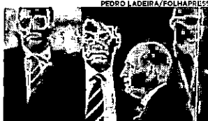
O ministro da Defesa, Fernando Azevedo, foi um dos sete que estiveram com Bolsonaro na segunda-feira

Todos que estiveram próximos do presidente, nos últimos dias, já decidiram fazer o teste. Um deles foi o ministro da Defesa, general Fernando Azevedo e Silva, que realizou o teste para coronavírus na manhã dessa terça-feira (7). O ministro disse que, além de ter estado com o presidente, optou em fazer uma nova testagem após descobrir que um servidor do Ministério, que ele teve contato, está com Covid-19. Há um prazo de até 72 horas para que o exame fique pronto, mas é possível que o resultado saia antes. Outro ministro que esteve com Bolsonaro foi o da Secretaria de Governo, general Luiz Eduardo Ramos. Ele informou que fez os exames, ontem cedo, no Palácio do Planalto. O ministro fez um teste rápido e o resultado já deu negativo. Segundo sua assessoria, a medida foi por