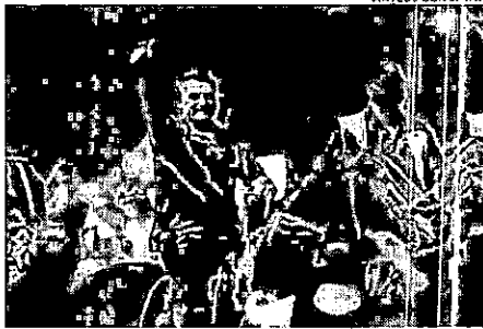
Presidente Jair Bolsonaro participou de reuniões e eventos públicos sem máscaras, minimizando a pandemia

A Justiça chegou a obrigar o presidente a usar máscara no Distrito Federal, onde uma lei garante multa de R$ 2 mil para quem descumprir. A Advocacia-Geral da União (AGU) recorreu com a liminar e derrubou a decisão. Na semana passada e esta semana, o presidente vetou 19 dispositivos do projeto que torna obrigatório o uso de máscaras em todo o Brasil.