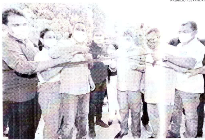
Mercado foi totalmente ampliado, ganhando praça de alimentação e novos boxes

Edivaldo segue com obras por toda a cidade. "Somente mercados serão dez entregues totalmente novos. É um marco muito importante para nossa cidade. E com o programa São Luís em Obras serão entregues muitos outros investimentos em toda a cidade, transformando a vida da população", disse. O deputado federal Márcio Jerry também destacou a importância das intervenções que a gestão do prefeito Edivaldo está fazendo nos mercados de São Luís. "O mercado do Anil era uma obra muito esperada e é mais uma prova do trabalho, esforço e determinação com que o prefeito Edivaldo está gerindo nossa capital em um momento de crise, fazendo um grande volume de investimentos", afirmou.